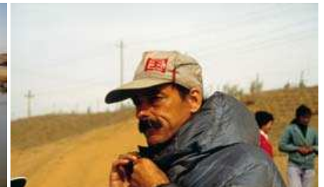
THE LOVERS: THE GREAT WALL WALK, 1988